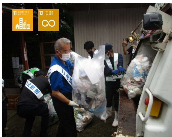
(環境パトロールの様子)