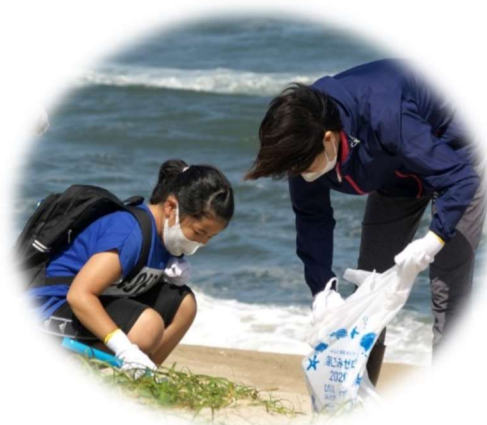
地球教室「海岸清掃をしよう！」の様子